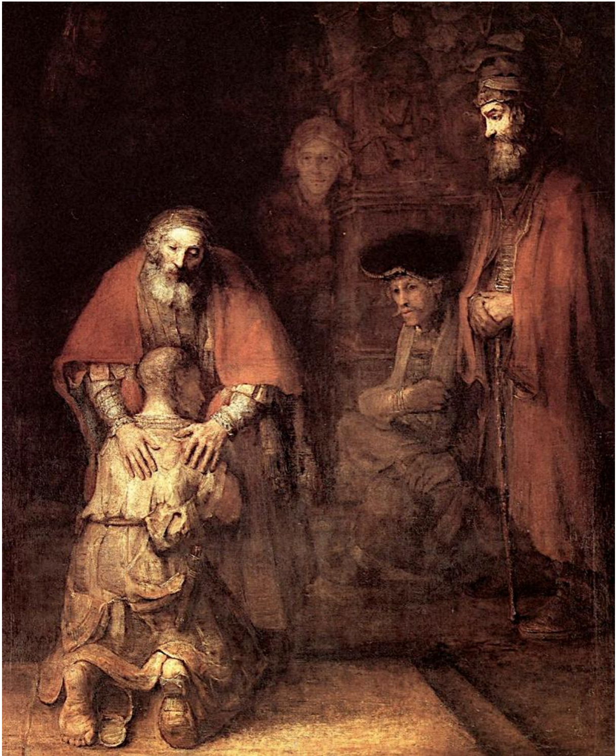
Rembrandta van Rijn „Powrót syna marnotrawnego”, XVII w.